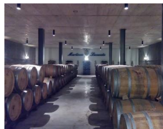
Martínez Lacuesta desde 1.895